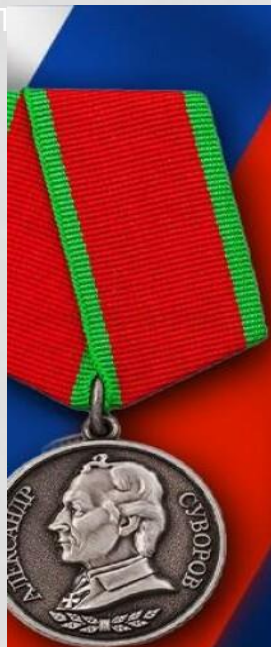
ГАСАН ГАСАНОВ НАГРАЖДЕН МЕДАЛЬЮ СУВОРОВА