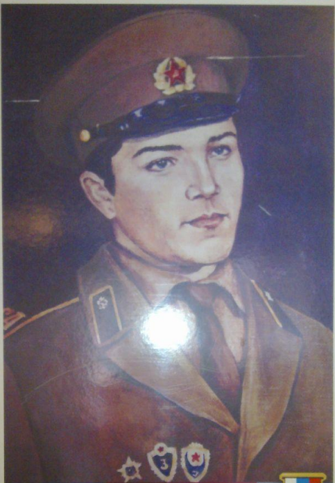
Гаджиев Нухидин Омарович Герой России